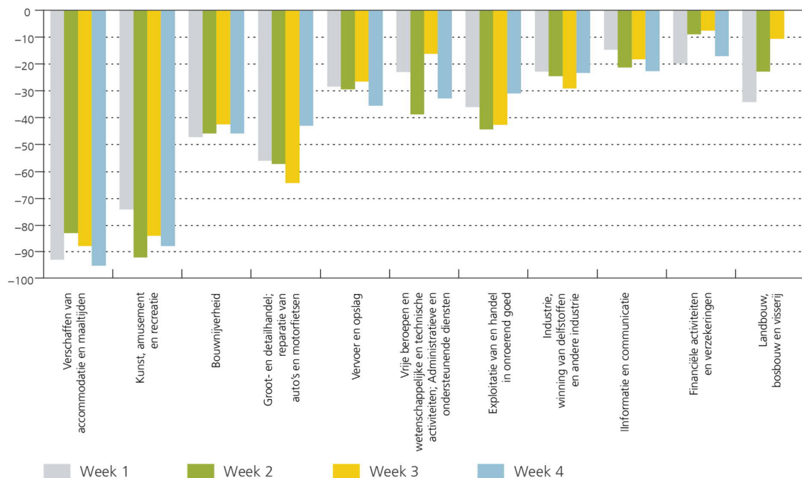
Grafiek 1: De daling van de omzet hangt af van de bedrijfstak en vertoont enkel geringe verschillen over de tijd (in %, gewogen gemiddelde op basis van de omzet)

Bronnen: BECI, Boerenbond, NSZ, UNIZO, UWE, VBO, VOKA, NBB.