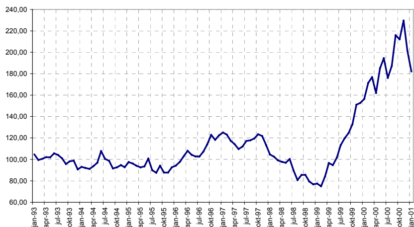
Index van de eenheidswaarde bij invoer van SITC3 (Minerale producten)