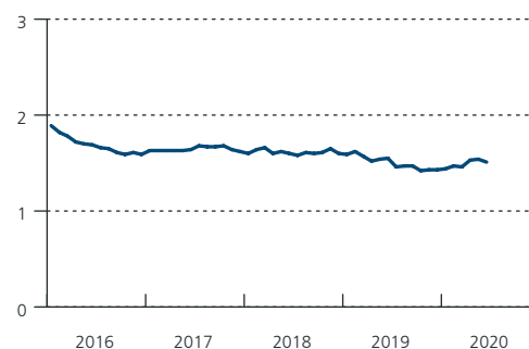
Taux moyen pondéré 3 (pourcentages)