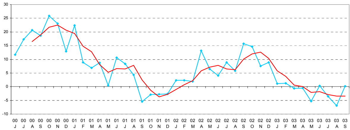
GRAPHIQUE 2 - IMPORTATIONS, POURCENTAGES DE VARIATION PAR RAPPORT AU MOIS CORRESPONDANT DE L'ANNÉE PRÉCÉDENTE